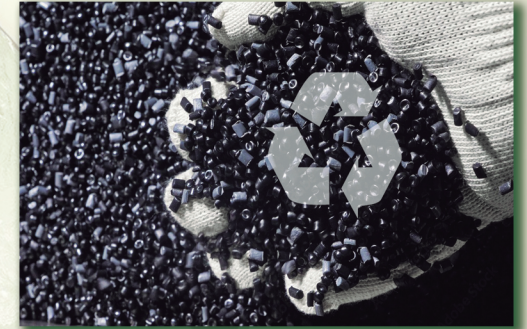
Mezcla de materiales para inyección en molde