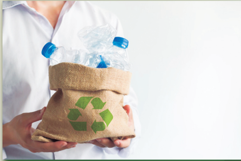
Recogida de residuos plásticos reciclables